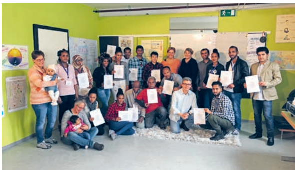
Die Asylsuchenden und Kursleiter waren stolz auf ihre sprachlichen Fortschritte im ersten Kurs.

Am 17. November 2017 durften die Asylsuchenden ein Zertifikat über den erfolgreichen Kursbesuch entgegennehmen. Mit einem Teil der Asylsuchenden wird nun ein Fortsetzungskurs durchgeführt, um das Niveau sukzessive zu verbessern.