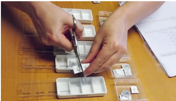
Spitex im täglichen Einsatz: Medikamente richten, Verbände wechseln und vieles mehr

Im geplanten Erweiterungsbau Sonnmatt ist die Erstellung eines regionalen Spitex-Stützpunktes vorgesehen. Unabhängig vom Zeitpunkt einer Fusion beabsichtigen die Spitexvereine Uzwil und Oberuzwil-Jonschwil-Lütisburg, ihren Stützpunkt ins Seniorenzentrum Uzwil zu verlegen. Der Spitex-Stützpunkt Oberuzwil-Jonschwil-Lütisburg hat am heu-