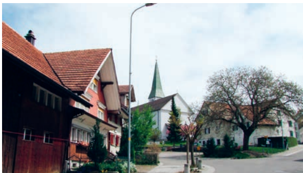
Der Nussbaum muss aus Sicherheitsgründen gefällt werden.

Die grossen Schneefälle von letzter Woche belasteten die Bäume schwer. Beim älteren Nussbaum an der Verzweigung Schul-/Kronenstrasse in Jonschwil brachen einzelne Äste ab. Am Abend des 14. Januar 2021 musste die Feuerwehr ausrücken und die Strasse vorübergehend sperren. Auf Empfehlung des beigezogenen Revierförsters musste ein sofortiger Sicherheitsschnitt durchgeführt werden.