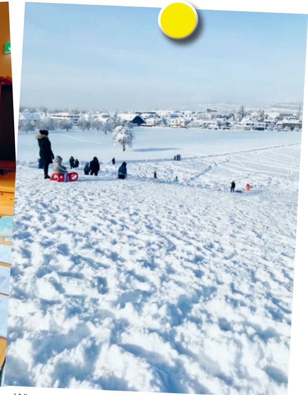
Wintertreffen auf dem Schlittelhang in Schwarzenbach