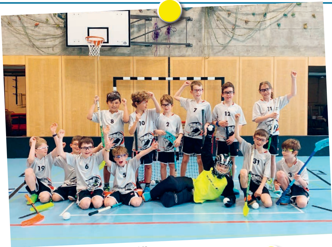
Unihockey-Turnier in der Degenau Ende März