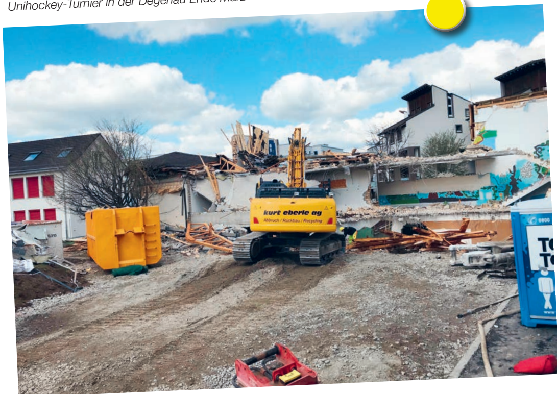
Rückbau Schwarzenbach; Stand 14. April 2021