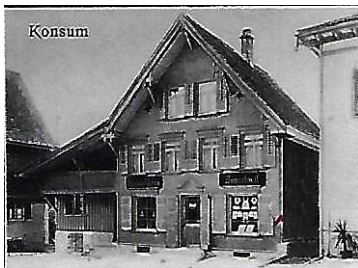
Erstes Jonschwil Postbureau an der Lütisburgerstr. 2