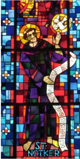
Chorfenster in der Jonschwiler Martinskirche.

Am 6. April 912 starb im Kloster St. Gallen Notker Balbulus (der Stammer). Sein Jonschwiler Ursprung ist nicht gänzlich gesichert, aber sehr wahrscheinlich.