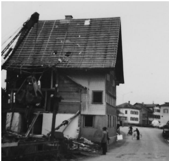
Abbruch der Liegenschaft Hegelbach an der Lütisburgerstrasse im Jahre 1974