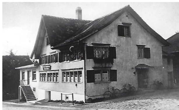
Restaurant und Bäckerei Kreuz ca. 1930