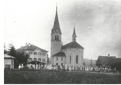
Ansicht des Jonschwiler Friedhofs von Osten her um ca. 1900