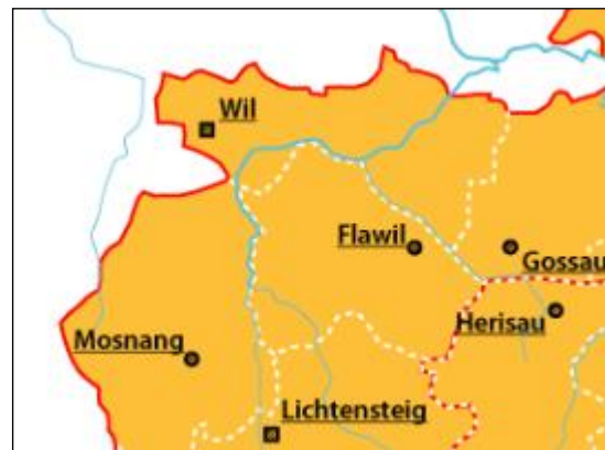
Distrikte im Kanton Sätis mit Hauptorten