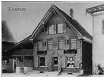
Erstes Jonschwil Postbureau an der Lütisburgerstr. 2