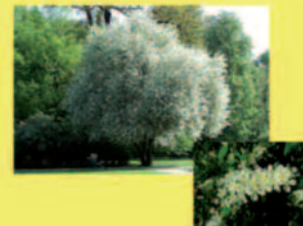
Traubenkirsche Prunus padus