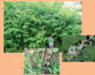
Japanischer Staudenknöterich Polygonum japonica