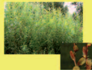
Purpurweide Salix purpurea