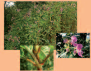
Drüsiges Springkraut Impatiens glandulifera