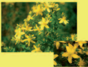
Johanniskraut Hypericum perforatum