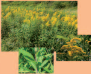
Goldruten Solidago canadensis Solidago gigantea