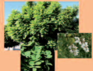
Gewöhnliche Robinie Robinia pseudoacacia