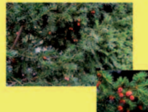
Eibe Taxus baccata