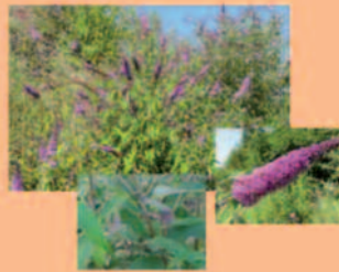
Sommerflieder Buddleja davidii