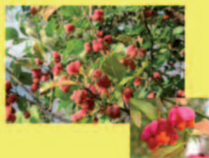
Pfaffenhütchen Euonymus europaeus