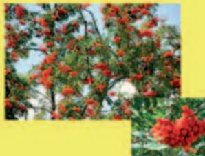
Vogelbeere Sorbus aucuparia