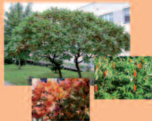
Essigbaum Rhus typhina