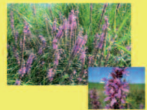
Blutweiderich Lythrum salicaria