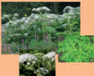
Riesenbärenklau Heracleum mantegazzianum