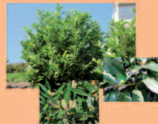
Kirschlorbeer Prunus laurocerasus