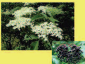
Schwarzer Holunder Sambucus nigra